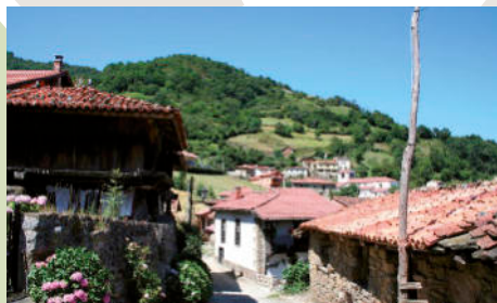
Xomezana Riba (D. Barraso)

El sendero continúa por los pastos de altura de la Braña Foxón, donde los rebaños de vacas campean aprovechando la hierba descubierta de nieve y que ofrece vistas al valle del Güerna. Se continúa subiendo en dirección norte, hasta alcanzar el punto más elevado de la ruta, la Vega de La Forcá, a 1.538 m de altura. Desde aquí se inicia el descenso hacia el barranco de Xomezana. Al llegar a la Braña del Pivaldal, podremos continuar la ruta siguiendo el recorrido del PR-AS 89 por un sendero de monte a media ladera, (recomendable en época de crecidas del río), o proseguir hasta el final por la ancha pista que desciende junto al río y que atraviesa un hermoso hayedo.