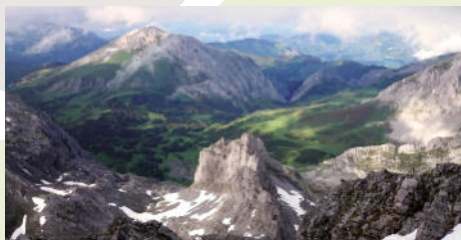
Puertos de Agüeria desde El Prau (J. Foggia)

Desde aquí, el camino, empedrado en tramos, cruza algunos regueros de los manantiales temporales de Los Garrafes. En Pará enlaza con la pista que sube a la ermita de Trobaniel.lo y el Puerto de Ventana, por la que desciende hasta la aldea de Bueida, en poco más de 2 km. Desde allí, la ruta finaliza en Ricao, tras 1 km de carretera.