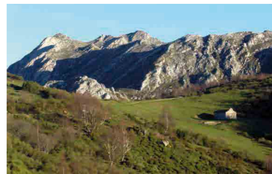
Ermita de Trobaniello/Trobaniel, lo. Quirós