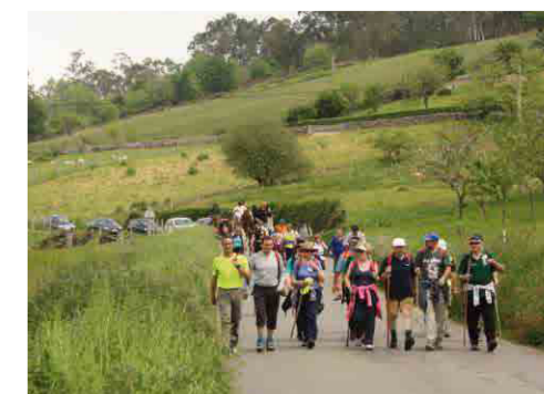
Alzada anual de la asociación