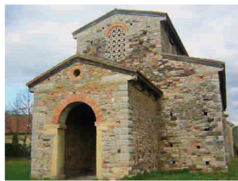
San Pedro de Nora. Las Regueras

reloj; con vestido y calzado rudimentario y sin más ayuda que sus conocimientos naturales; los lazos de amistad establecidos en el camino de alzada y el coraje que les caracterizó.