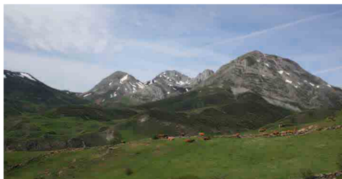
Los puertos de Torrestío

Llevaron a Torrestío el asturiano central, convirtiéndolo en una isla lingüística, circundada por pueblos que se expresaban en bable occidental. Por ello se denominaron siempre vaqueros(us)/as(es) , pero nunca vaqueiros/as . Influyeron además en la toponimia y en rasgos culturales como que Torrestío conserva el mayor conjunto etnográfico de hórreos de tipo astur y leonés de toda Babia.