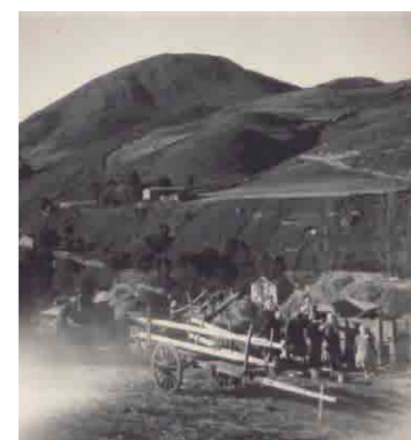
Vaqueros en Torrestío

En algunos concejos, como por ejemplo en la parroquia de Villardeveyo en Llanera (Ref: J. A. Vaquero), los vaqueros sufrieron marginación social. No obstante esta marginación, más bien debida a una cuestión económica y de pago de impuestos, no estaba generalizada. El 91% de los censados en Torrestío en 1816 estaban inscritos como hijosdalgo notorios o hijosdalgo de Privilegio .