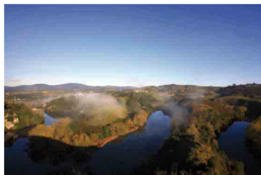
Meandros del Nora. Oviedo y Las Regueras