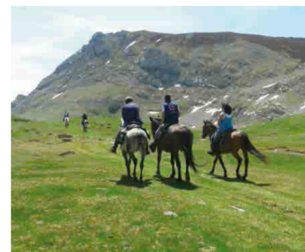
Camín de La Mesa